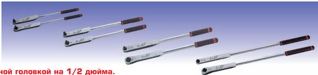
Ключи с квадратной головкой на 1/2 дюйма.