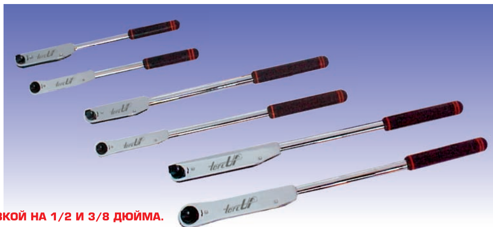
КЛЮЧИ С КВАДРАТНОЙ ГОЛОВКОЙ НА 1/2 И 3/8 ДЮЙМА.